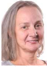
Konsbrück Malou Pensionéiert